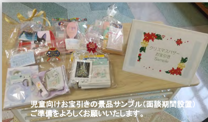
児童向けお宝引きの景品サンプル(面談期間設置)ご準備をよろしくお願いいたします。