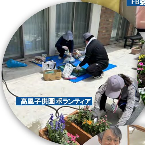
高風子供園ボランティア