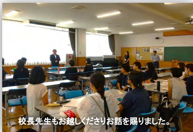
校長先生もお越し下さりお話を賜りました。

12月のクリスマスバザーに向けて4つのグループで企画検討を行っています。 お楽しみに。