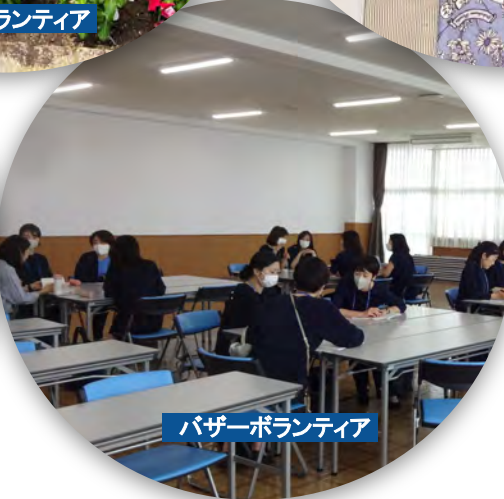
バザーボランティア