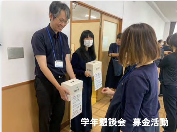
学年懇談会 募金活動

FB委員にご準備いただいたポロシャツの引換えを学年幹事が対応いたしました。皆様のご協力のお陰でご注文いただいた全ての方へのお引換えが完了いたしました。お子様の反応はいかがでしたか。