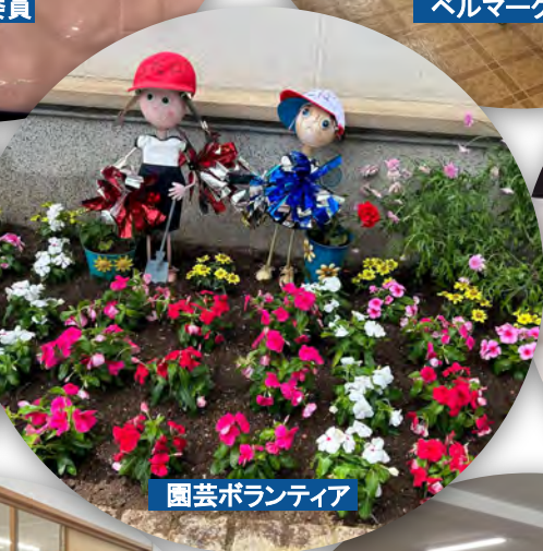
園芸ボランティア