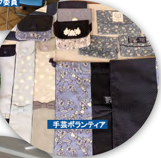
手芸ボランティア