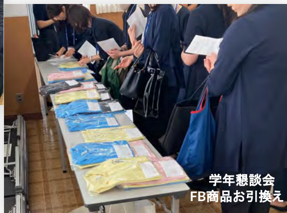
学年懇談会 FB商品お引換え

FB委員にご準備いただいたポロシャツの引換えを学年幹事が対応いたしました。皆様のご協力のお陰でご注文いただいた全ての方へのお引換えが完了いたしました。お子様の反応はいかがでしたか。