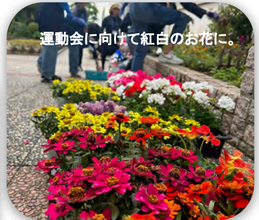
運動会に向けて紅白のお花に。